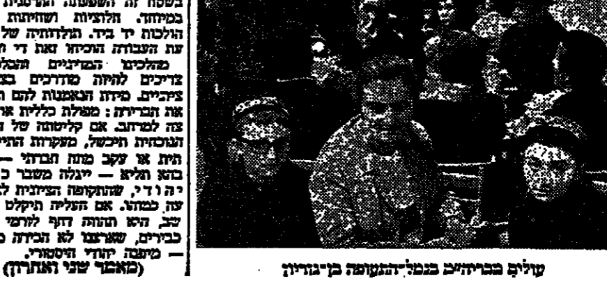
עולים בבריחה במהלך המהפכה הקומוניסטית